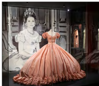
L'ARTE A MONACO L'Art à Monaco