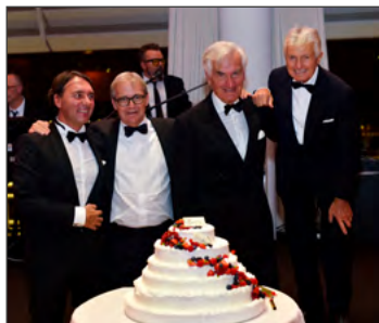
AIIM - SERATA DI GALA Soirée de Gala