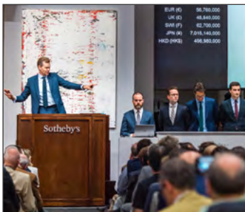
IL MERCATO DELL'ARTE Le Marché de l'Art